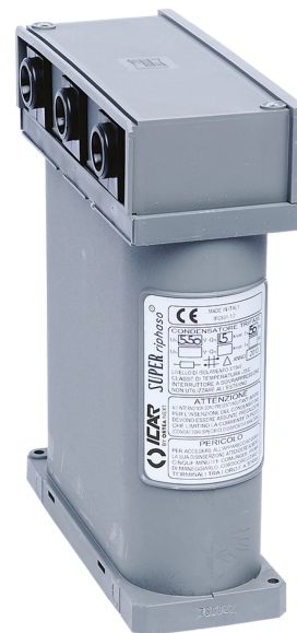
Imagen solo con fines ilustrativos.