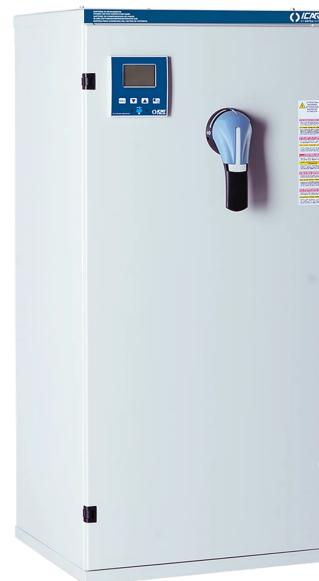
Imagen solo con fines ilustrativos.