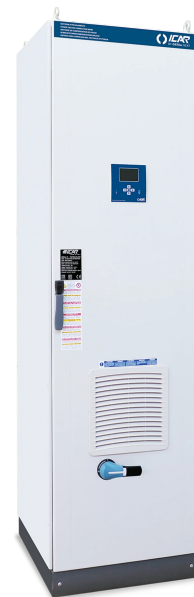
Imagen solo con fines ilustrativos.