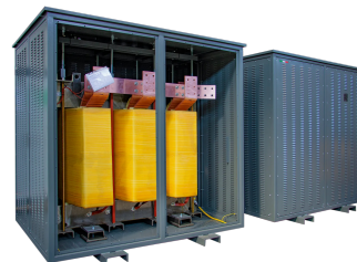
Imagen solo con fines ilustrativos.