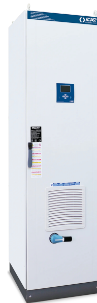
Imagen solo con fines ilustrativos.