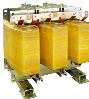
Imagen solo con fines ilustrativos.