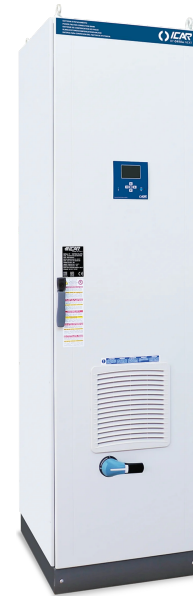
Imagen solo con fines ilustrativos.