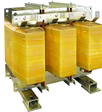
Imagen solo con fines ilustrativos.