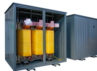
Imagen solo con fines ilustrativos.